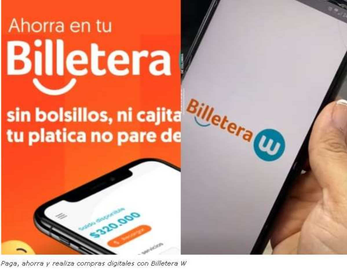
Paq, ahorra y realiza compras digitales con Billetera W

El Banco W ha lanzado una propuesta innovadora para los ahorradores en Colombia. Le contamos los beneficios