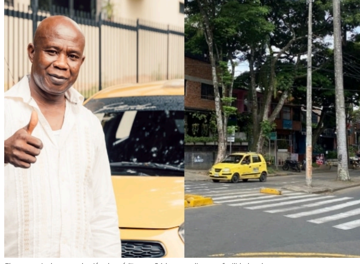
El proceso incluye aprobación de créditos en 24 horas y diversas facilidades de pago

El enfoque de esta alianza entre Banco W y Clave 2000 es fomentar y convertir en empresarios a conductores y propietarios de sus vehículos productivos. Le contamos cómo han logrado impactar a muchos taxistas en varias ciudades de Colombia