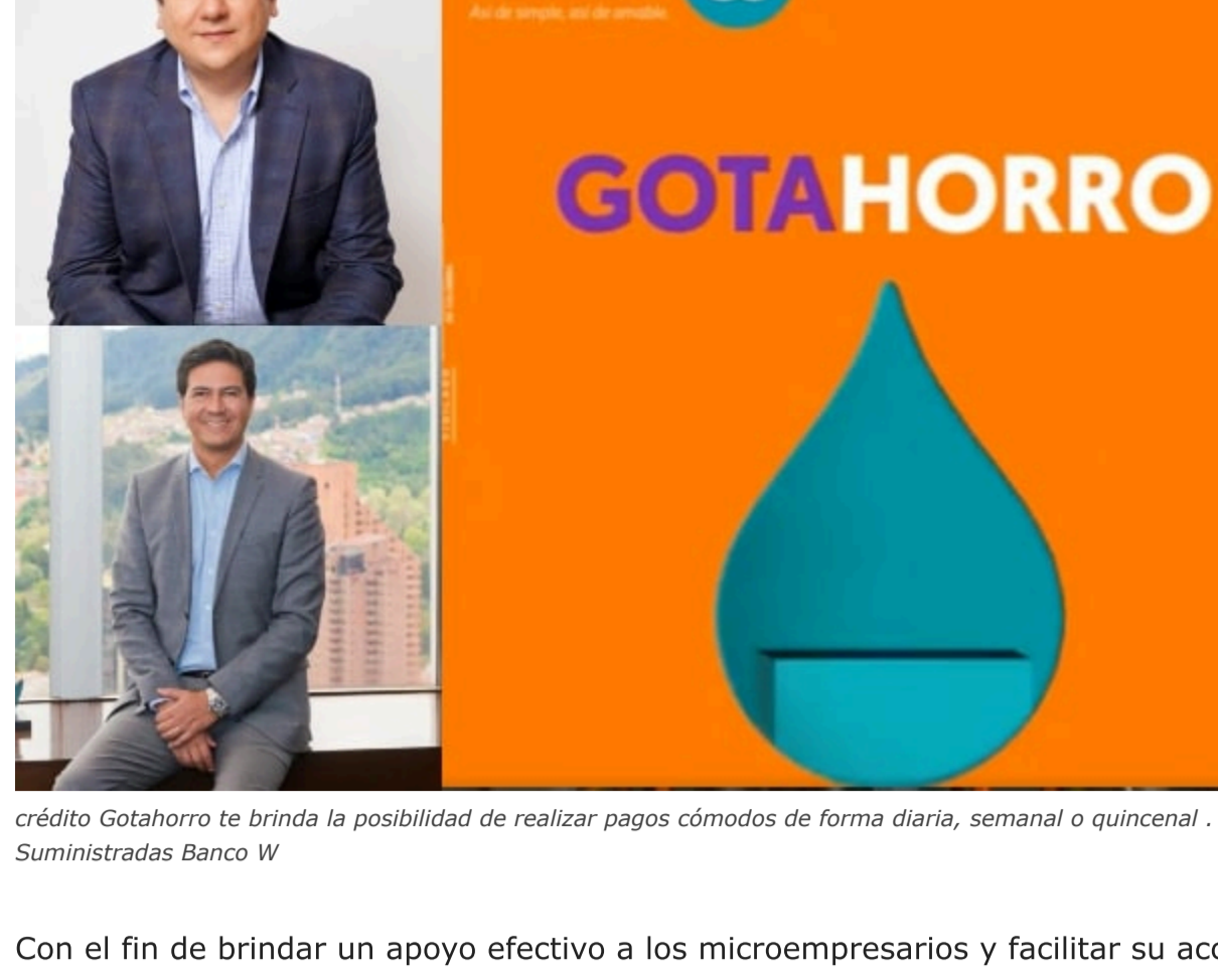
crédito Gotahorro te brinda la posibilidad de realizar pagos cómodos de forma diaria, semanal o quincenal.

Con el fin de brindar un apoyo efectivo a los microempresarios y facilitar su acceso al crédito adecuado, el Banco W ha lanzado su microcrédito digital 'Gotahorro'. Esto será posible a través de la plataforma Neocrédito de Bancoldex