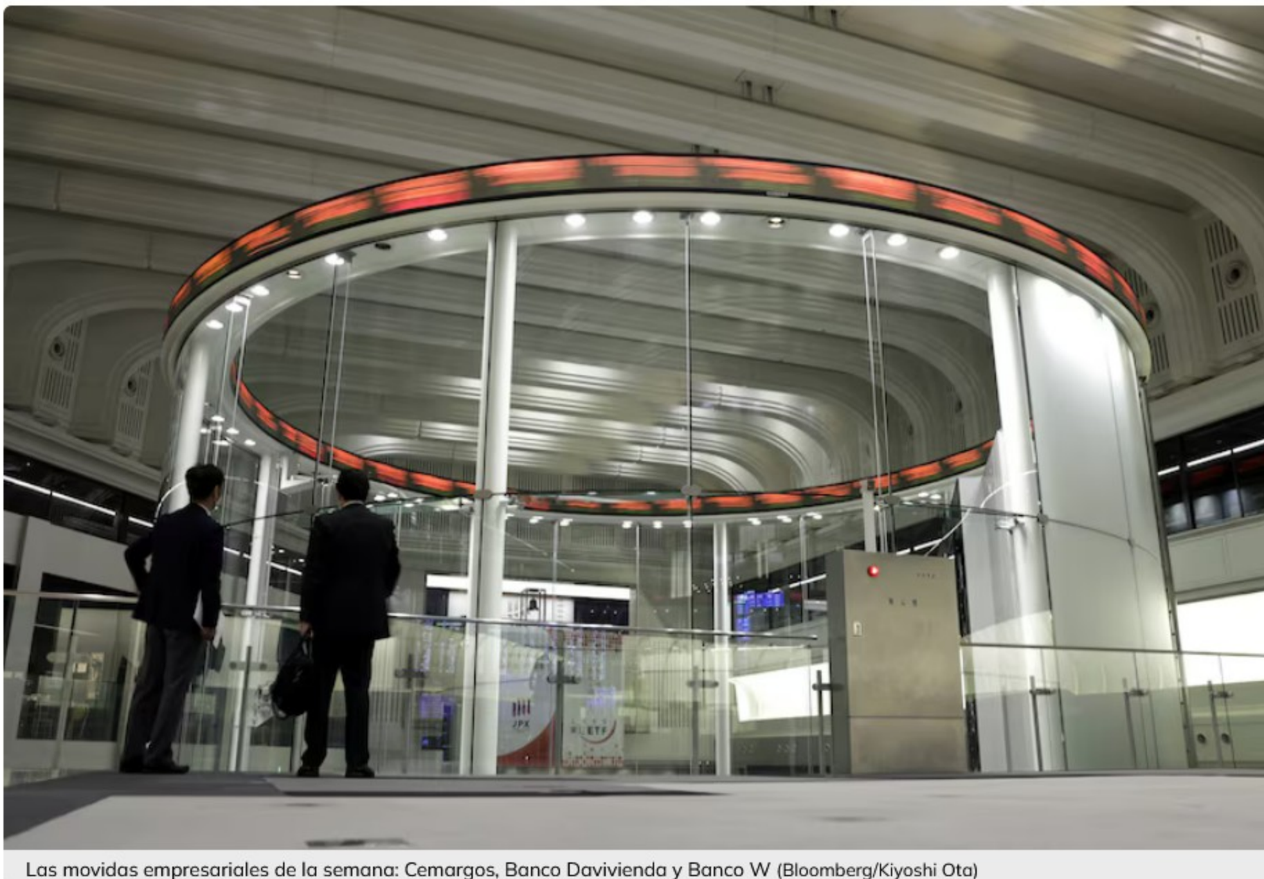
Las movidas empresariales de la semana: Cemargos, Banco Davivienda y Banco W

Terpel firmó un contrato con Cenit, Cementos Argos lanzó una nueva oferta de readquisición de acciones por COP$25,000 millones y el Banco Davivienda aumentó su inversión en Holding Davivienda Internacional S.A. Además, UNE EPM (Tigo) adelanta un plan de retiro voluntario de empleados