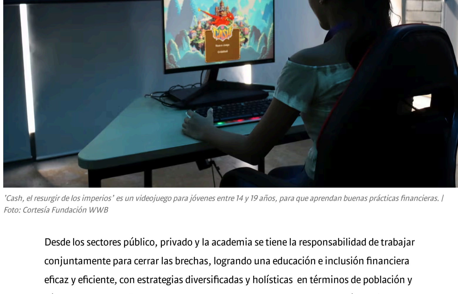
'Cash, el resurgir de los imperios' es un videojuego para jóvenes entre 14 y 19 años, para que aprendan buenas prácticas financieras.

Llevar la educación financiera a las instituciones educativas debe ser un trabajo mancomunado entre el Ministerio de Educación Nacional y las demás entidades que tienen los conocimientos necesarios. Diseñar, desde la economía del comportamiento, metodologías innovadoras y disruptivas, es el videojuego 'Cash, el resurgir de los imperios', puede generar cambios culturales que beneficien a la sociedad en el tiempo, lo que llevará a que también los jóvenes disfruten de una inclusión financiera al acceder a productos y servicios financieros que se adapten a sus necesidades.