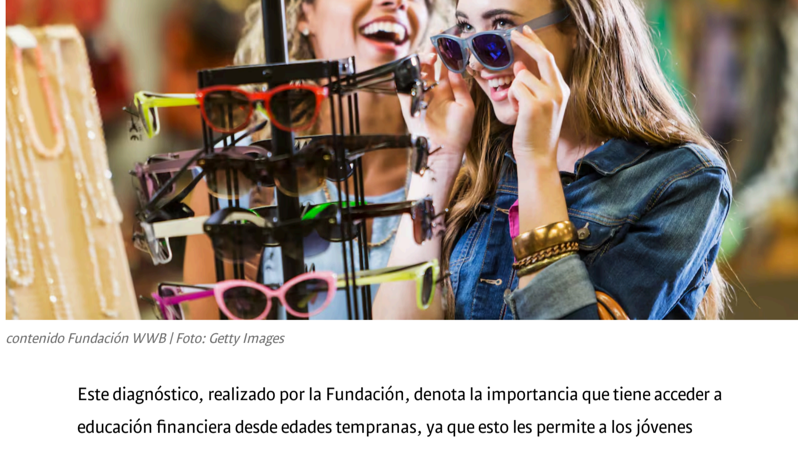
contenido Fundación WWB | Foto: Getty Images

En un informe hecho por la Fundación WWB Colombia para FinDev (Inclusión Financiera para el Desarrollo) se encontró que los comportamientos financieros de las personas jóvenes en América Latina (entre los 18 y 25 años) están guiados, en su mayoría, por el consumo de bienes y productos inmediatos, dando mayor importancia a los beneficios del presente sobre las posibilidades a futuro, tendiendo a consumos más allá de sus capacidades monetarias.