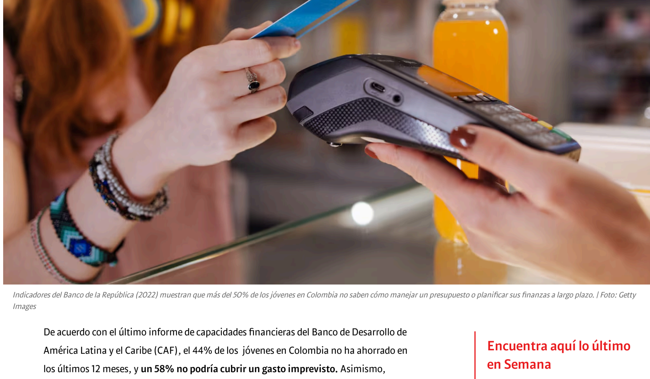
Indicadores del Banco de la República (2022) muestran que más del 50% de los jóvenes en Colombia no saben cómo manejar un presupuesto o planificar sus finanzas a largo plazo.

De acuerdo con el último informe de capacidades financieras del Banco de Desarrollo de América Latina y el Caribe (CAF), el 44% de los jóvenes en Colombia no ha ahorrado en los últimos 12 meses, y un 58% no podría cubrir un gasto imprevisto. Asimismo, indicadores del Banco de la República (2022) muestran que más del 50% de los jóvenes en Colombia no saben cómo manejar un presupuesto o planificar sus finanzas a largo plazo. Además, solo un 15% tiene algún conocimiento básico sobre inversiones.