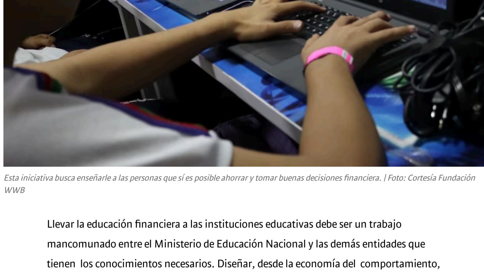
Esta iniciativa busca enseñarle a las personas que sí es posible ahorrar y tomar buenas decisiones financieras.