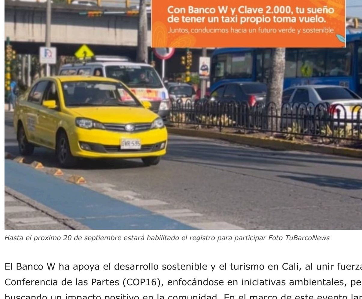
Hasta el próximo 20 de septiembre estará habilitado el registro para participar

El Banco W ha apoyado el desarrollo sostenible y el turismo en Cali, al unir fuerzas con la Conferencia de las Partes (COP16), enfocándose en iniciativas ambientales, pero también buscando un impacto positivo en la comunidad. En el marco de este evento lanza una jornada de capacitación para taxistas.