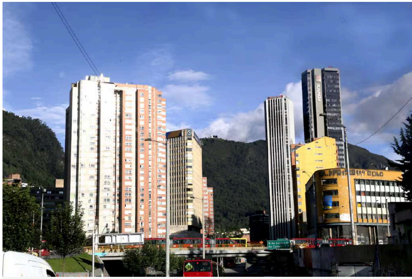
Desde el primero de mayo, la idea de inversión forzosa propuesta por el presidente Gustavo Petro en el discurso del día del trabajador ha estado resonado.

La banca privada presentó un plan de inversión de $35 billones destinados a "programas clave" para que no haya inversión forzosa.