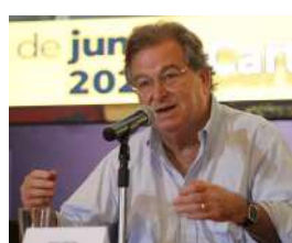
ECONOMÍA Jaime Gilinski pidió a los empresarios que sigan invirtiendo en el país