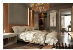
Se registró nuevamente una caída en ocupación e ingresos de los Alojamientos Turísticos

El jefe de cartera mencionó que el proyecto se presentará luego de la radicación del presupuesto general del próximo año, que sería el 29 de julio.