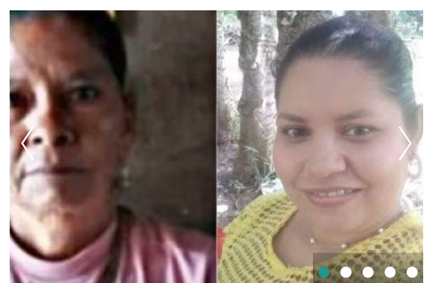
JUDICIAL Doble feminicidio: hombre asesinó a su pareja sentimental y a su suegra