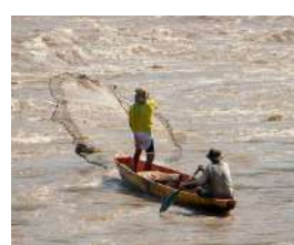
COLOMBIA Gobierno invertirá $40 mil millones para fortalecer sectores de la pesca en el pacífico y Nariño