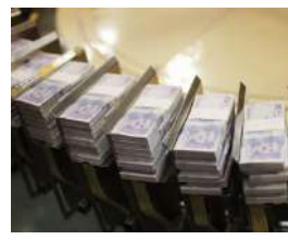
NACIONAL Pese a mayor gasto público, la economía colombiana no despega: análisis del Instituto de Ciencia Política