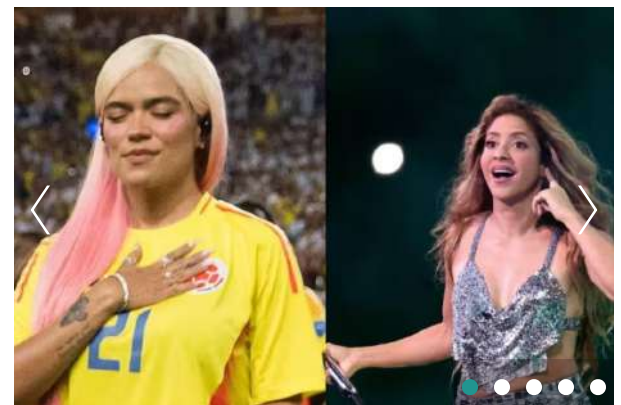
TENDENCIAS ¿La venganza de Shakira? Esta sería la verdadera razón del desplante a Karol G en la Copa América