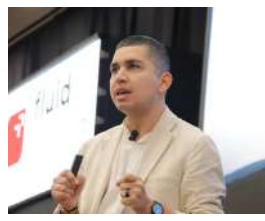
NACIONAL Petro insiste en inversión forzosa: la banca se opone