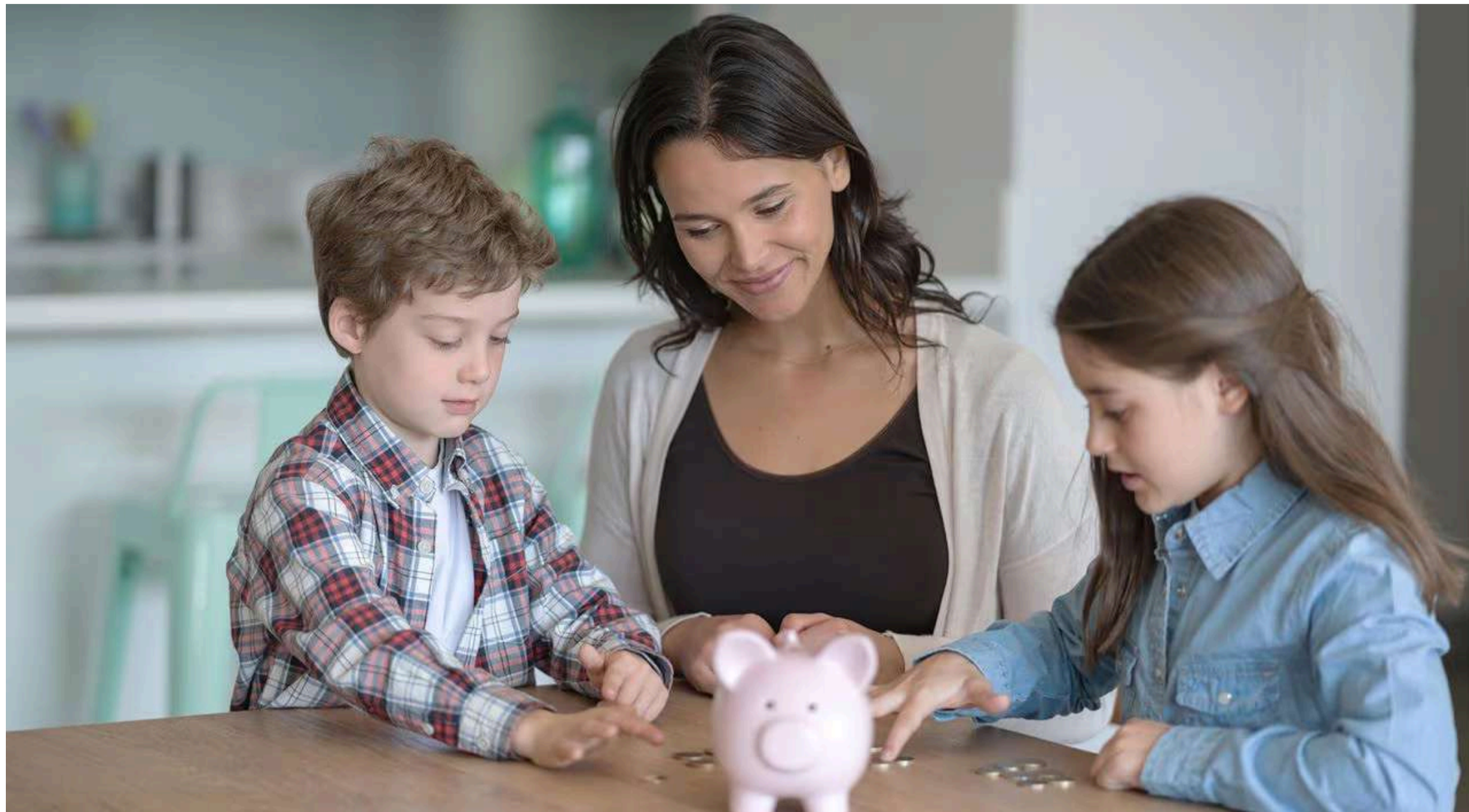
La inclusión financiera es fundamental para el progreso económico y el bienestar de la sociedad, ya que contribuye a disminuir el impacto de crisis sociales, reduce la pobreza y fomenta el crecimiento económico.

La educación financiera es fundamental para la seguridad y estabilidad de las personas, y por ello varias entidades bancarias buscan educar a través de portales para que los ciudadanos tomen decisiones informadas y mejoren su bienestar económico.