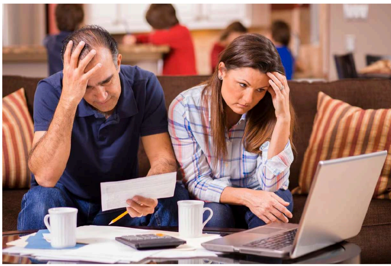
La educación financiera promueve la toma de decisiones informadas y conscientes, además de ayudar a las personas a aprovechar al máximo los servicios financieros formales para mejorar su calidad de vida.

En ese sentido, algunos de los bancos que están implementando este tipo de iniciativas son Davivienda, Bancolombia, Banco Mundo Mujer, Banagrario, entre otros. Por ejemplo, Davivienda, a través de los portales Mis Finanzas para Invertir, Mis Finanzas para Mi Negocio y Mis Finanzas en Casa, aborda temas de inversión, ahorro, prevención del fraude y la importancia de la planificación financiera a largo plazo.