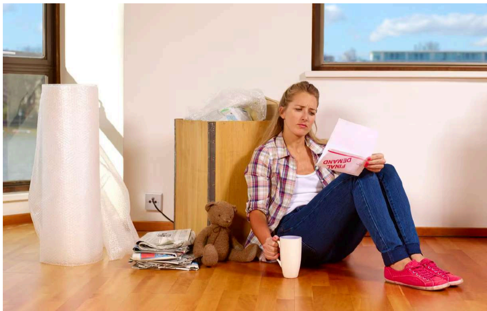
Es clave señalar que los programas de Davivienda, Bancolombia, Bancoomeva y Banco Mundo Mujer, tienen el sello de calidad de Educación Financiera, que es una distinción a las entidades vigiladas por la Superintendencia Financiera de Colombia, y los gremios del sector.

Es clave señalar que los programas de Davivienda, Bancolombia, Bancoomeva y Banco Mundo Mujer tienen el sello de calidad de educación financiera , que es una distinción a las entidades vigiladas por la Superintendencia Financiera de Colombia, y los gremios del sector, los cuales buscan ofrecer opciones para que el país crezca en materia de educación en este sentido, e inclusión.