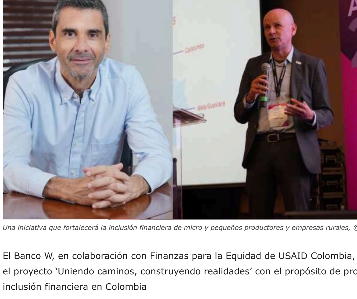
Una iniciativa que fortalecerá la inclusión financiera de micro y pequeños productores y empresas rurales, @BancoW

El Banco W, en colaboración con Finanzas para la Equidad de USAID Colombia, ha lanzado el proyecto 'Uniendo caminos, construyendo realidades' con el propósito de promover la inclusión financiera en Colombia