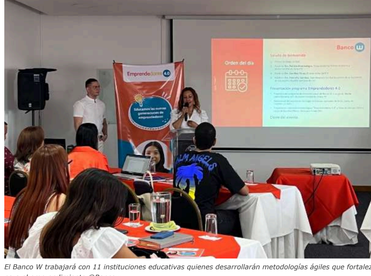
El Banco W trabajará con 11 instituciones educativas quienes desarrollarán metodologías ágiles que fortalezcan habilidades para el emprendimiento @Bancow

El Banco W ha escogido 11 colegios públicos de Cali para participar en su programa de inversión social 'Emprendedores 4.0', con el objetivo de cultivar habilidades emprendedoras entre los estudiantes como base para fomentar la innovación personal y productiva