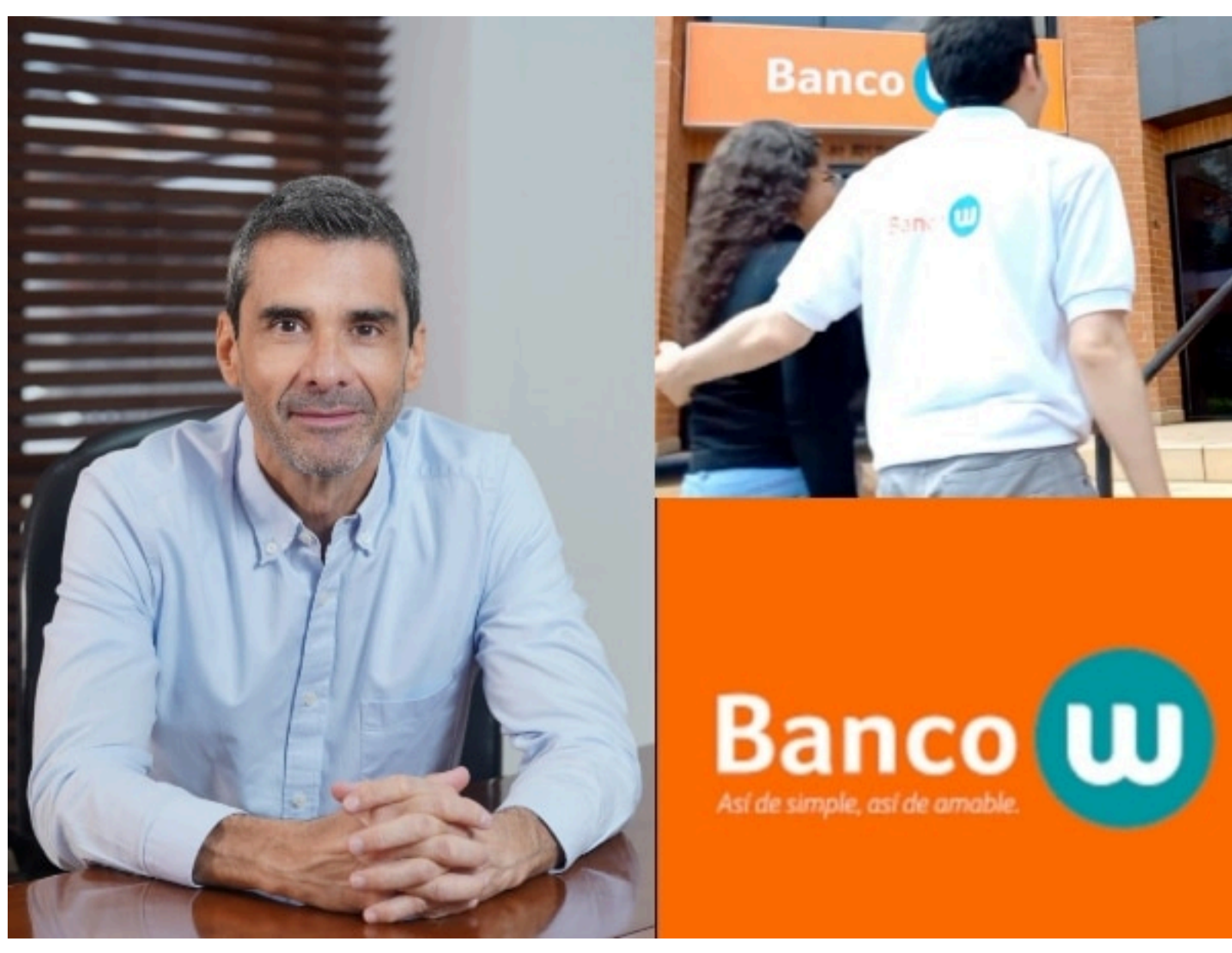
Banco colombiano que aporta al desarrollo económico y social brindando soluciones financieras para micronegocios y pequeñas empresas. @BancoW

Con el pago de la primera emisión del Banco W, han aportado de manera significativa al desarrollo sostenible del país con la inclusión financiera, generación de empleo y crecimiento económico.